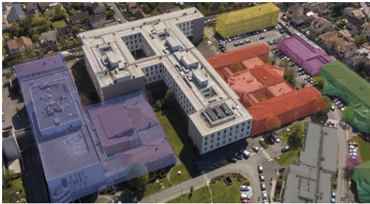
Centre Hospitalier d'Argenteuil, Paris