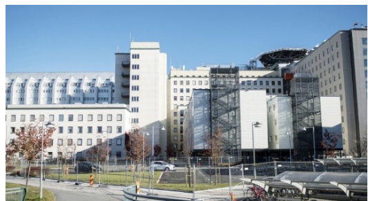
Klinik Umea, Schweden