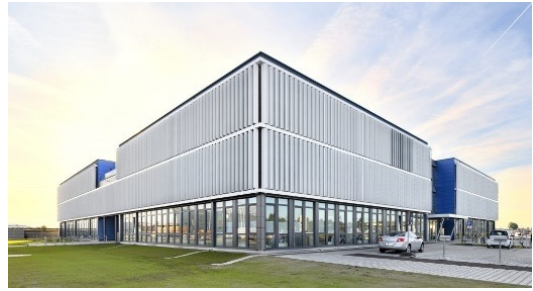
Bürogebäude Flughafen München