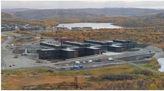
Klinik Kirkenes, Norwegen