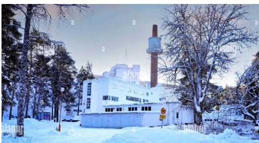
Krankenhaus Jyväskylä, Finnland